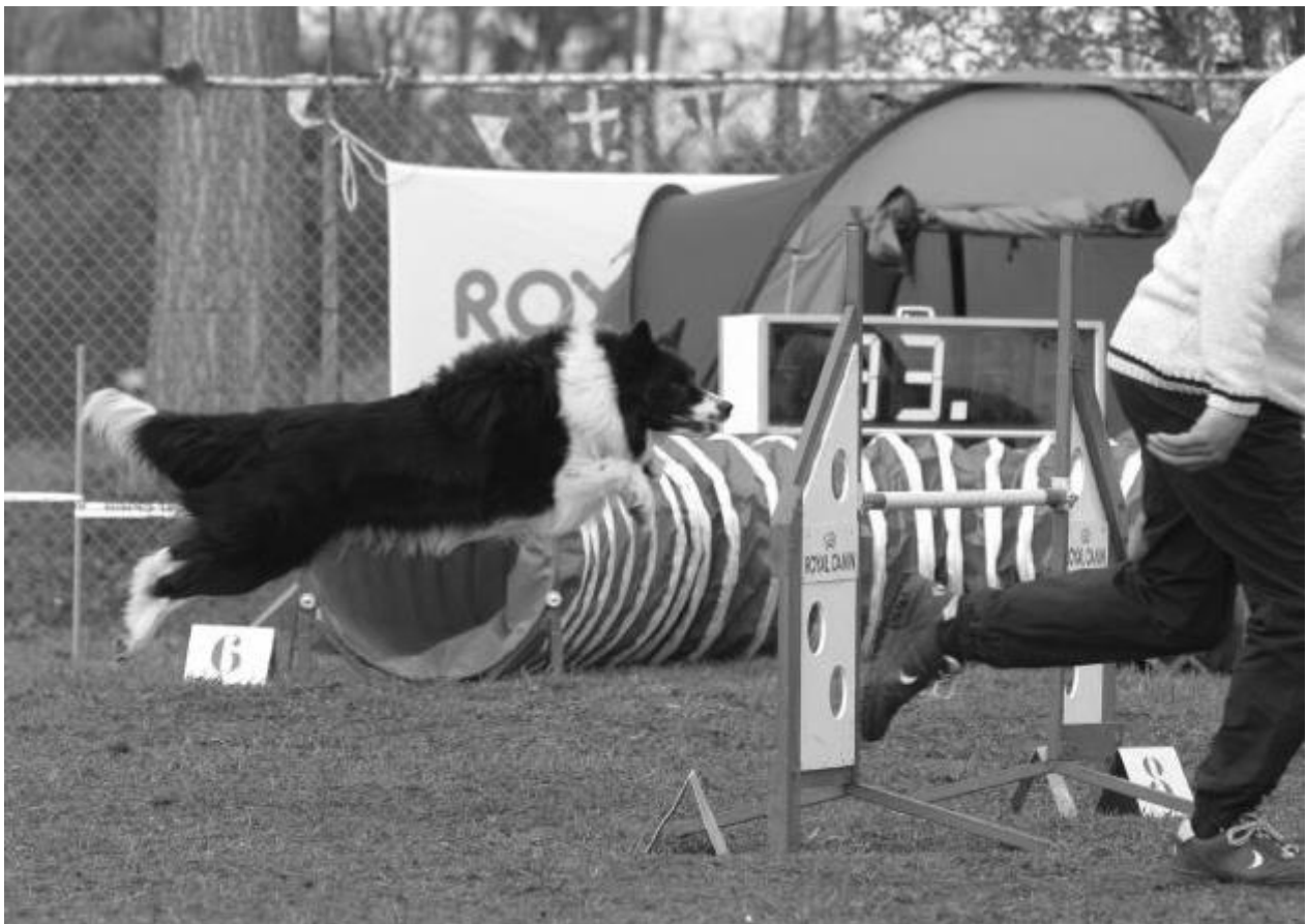
Als dit maar goed gaat.....

Wedstrijden zijn ingedeeld in klassen van verschillende niveaus, dus als beginnende wedstrijdloper loop je echt niet meteen tegen de fanatieke routinier. Daarnaast heb je deelnemers die zeer competitief ingesteld zijn, maar er zijn ook heel veel mensen die gewoon wedstrijden lopen omdat ze het een leuke hobby vinden. Je moet een wedstrijd ook zien als een leuke dag uit samen met je hond en samen met andere mensen die dezelfde hobby hebben. Misschien ga je wel samen met je trainingsmaatjes en als je eenmaal een paar keer bij een wedstrijd geweest bent, leer je al snel andere mensen uit het hele land kennen, met wie je ervaringen kunt uitwisselen. Over het algemeen krijgen mensen de smaak te pakken als ze eenmaal een paar keer zijn geweest. Als je agility een leuke hobby vindt, wat is er dan leuker dan een hele dag met je hobby bezig zijn samen met andere mensen die dezelfde hobby hebben?