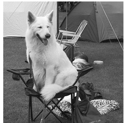
Altijd makkelijk, een stoel....

De hele dag staan of in het gras zitten/liggen is zeker niet alles. Een klapstoel waarop je lekker zit, is echt aan te raden. Veel mensen volgen de wedstrijd vanuit hun eigen stoel langs de kant van de ring. Let wel op dat je niet te dicht aan de ring gaat zitten en ga zeker niet met een (reactieve) hond vlakbij de ring zitten of staan.