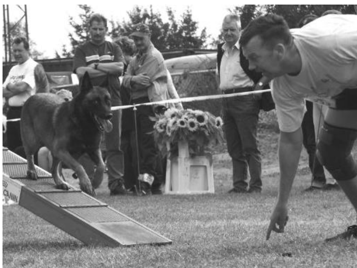
Het hele raakvlak!

Schiet de hond de ring uit omdat hij na het nemen van een toestel door zijn snelheid doorschiet, maar vervolgt hij wel gewoon het parcours, dan zien de meeste keurmeesters dit door de vingers.